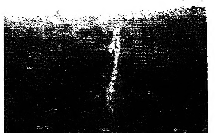
طريق غلييري سمان - الفياح (بشارة الشاي)